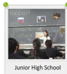
Junior High School